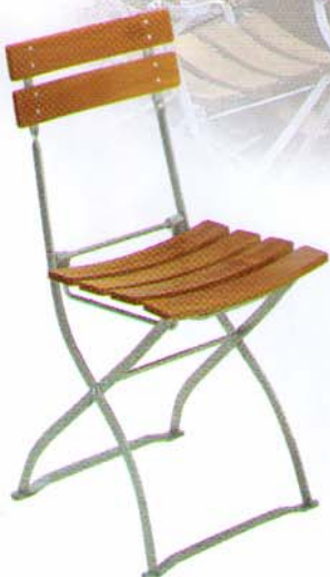
Klappstuhl mit 2 Rückenbrettern Bestell-Nr. 5032