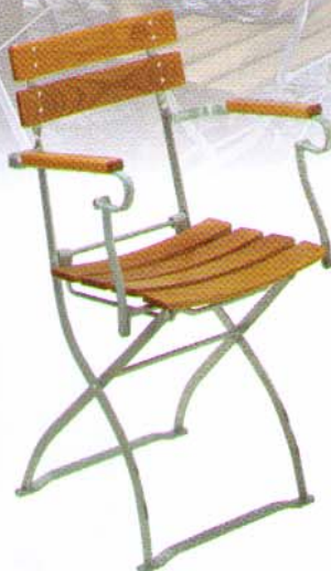
Klappstuhl mit 2 Rückenbrettern und Armlehnen Bestell-Nr. 5032 AL