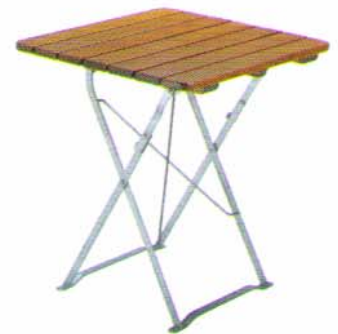
Klapptisch 70 x 70 cm Bestell-Nr. 5190