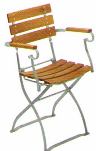
Klappstuhl mit 3 Rückenbrettern und Armlehnen Bestell-Nr. 5033 AL