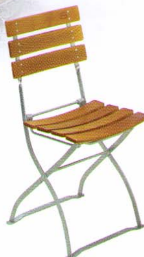
Klappstuhl mit 3 Rückenbrettern Bestell-Nr. 5033