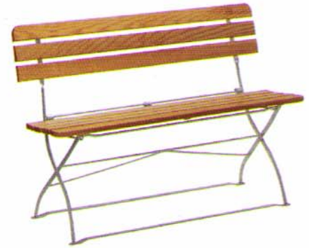
Bank mit 3 Rückenbrettern, 120 cm lang Bestell-Nr. B 23