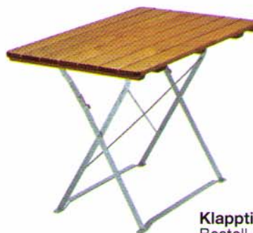
Klapptisch 120 x 70 cm Bestell-Nr. 5112