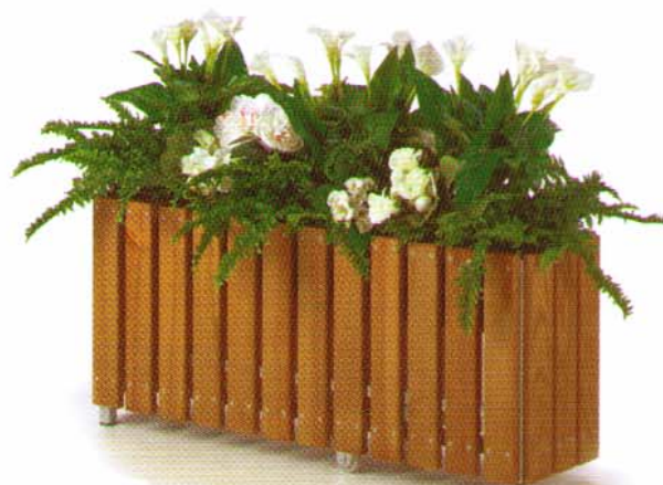
Pflanzkasten fahrbar 84 cm und 104 cm

Sonnenschirm Ø 180 cm Sonnenschirm Ø 250 cm