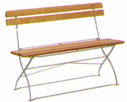
Bank mit 2 Rückenbrettern, 120 cm lang Bestell-Nr. B 22