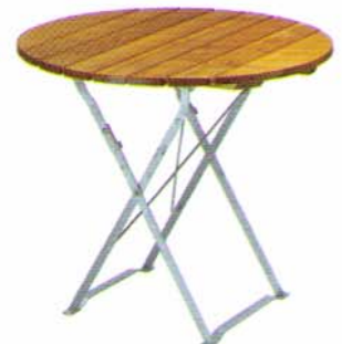
Klapptisch Ø 90 cm Bestell-Nr. 5190